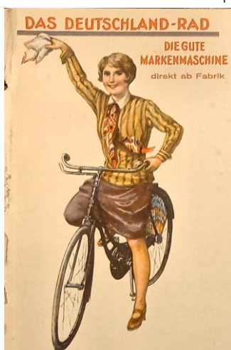
Stukenbrok-Werbekarte von 1928

Klar ist – dank der ebenfalls im Netz nachschlagbaren Hamburger Adressbücher (Teile II und IV) – wann Stukenbrok in St. Georg präsent war: Von