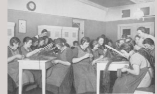
Insassinnen der „Besserungs-Anstalt“ des Werk- und Armenhauses in Hamburg-Farmen