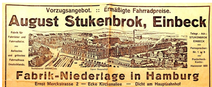
Aus einem Werbeplakat etwa von 1927