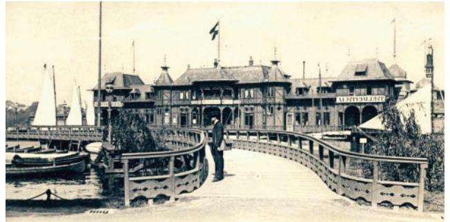
Der Steg zur „Alsterlust“ ca. 1910, zeitgen.Postkarte

gesichts der unmittelbar benachbarten Einmündung des Eilbekkanals überrascht dies nicht, denn wer schwimmt schon gerne mit Wandsbeker Exkrementen um die Wette. In jüngerer Zeit wurden wiederholt Vorschläge für eine Wiederbelebung des Freibades am Schwanenwik gemacht; so war die Rede von einem „Ole von Beust-Bad“ oder von einem „Alsterpool“. Alle Vorschläge scheiterten nicht zuletzt an der weiterhin nur mäßigen Wasserqualität der Außenalster (obwohl der Verfasser berichten kann, dass ihm ein unfreiwilliges Bad in der Außenalster in jungen Jahren nicht geschadet hat). - Ergänzt wurde das