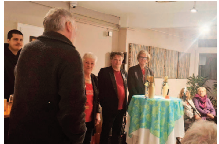
Der Dank der Geschichtswerkstatt für das 25jährige Wirken des Literarischen Menüetts am 1. März im Kulturladen