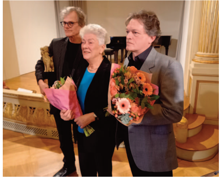
Die Preisträger*innen des Goldenen Drachen 2023, verliehen am 28. Januar 2024 im Museum für Kunst und Gewerbe

Übrigens sind für die zweite Aufführung des aktuellen Programms „Vom Sprengen des Gartens, der Welt“ am Sonntag, den 11. April, um 19.00 Uhr, im Kulturladen (Alexanderstraße 16) noch einige Plätze frei, Kostenpunkt 20 Euro. inkl. Buffet, ohne Getränke, Anmeldung per E-Mail an info@gw-stgeorgf.de .