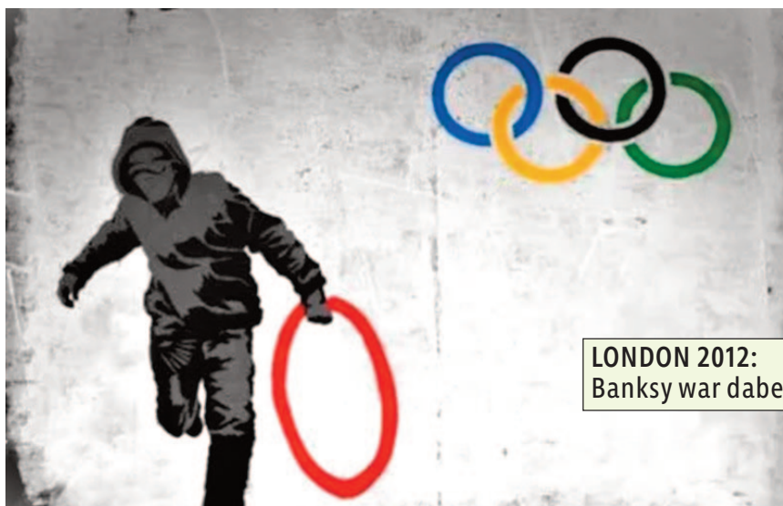
LONDON 2012: Banksy war dabei !