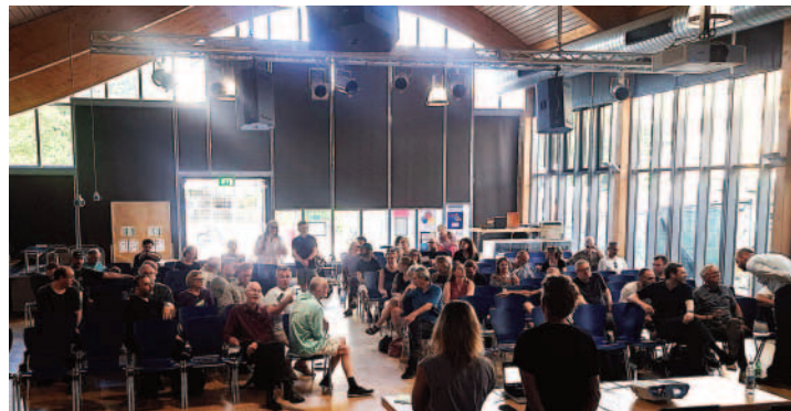
60 Teilnehmer*innen trotz großer Hitze in der PAULA